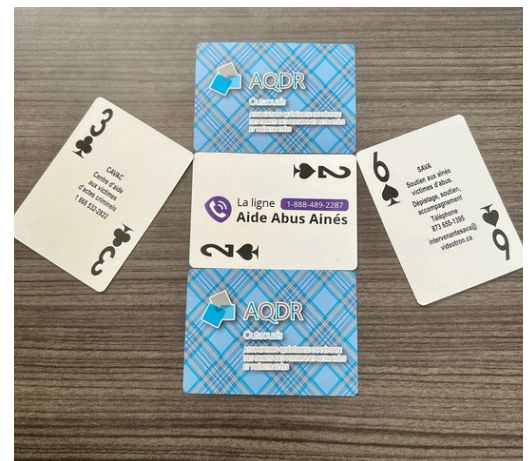
Photo jeu de cartes informatif

Nous avons aussi mis à jour notre jeu de cartes informatif sur la maltraitance. Nous avons fait réimprimer notre jeu de cartes qui donne les noms et les coordonnées de plusieurs ressources touchant à la maltraitance dans la région et au Québec.